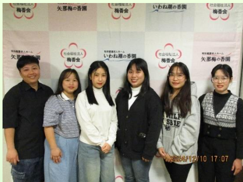
先輩のベトナム介護実習生と 🇻🇳

こんにちは(^^♪このところかなり冷え込んでまいりました。私自身もそうですが、皆様も体調管理には十分気をつけてくださいね。そんな中、温暖な東南アジア(ベトナム)より待ちに待ったベトナム介護実習生(第3期生)2名が新たに「矢那梅の香園」での就業を(12/10)よりスタートしました!!当梅香会ではこれまでの第1期生、第2期生、合わせて4名が既に我々の仲間となって頂いており、今回の第3期生を合わせますと総勢6名のベトナム人介護実習生が日々日本人スタッフと一緒に汗を流してくれております。「皆さん本当にありがとうございます。」当法人では今後も第4期生、第5期生を受け入れる予定でもあり、これからもベトナム介護実習生と一緒に精進してまいりたいと思っております。今回は第3期生(2名)の実習生が初めて「矢那梅の香園」に来られた時の一コマをご覧いただきたく記事とさせて頂きました。お時間あるときにお読みいただけましたら幸いです。