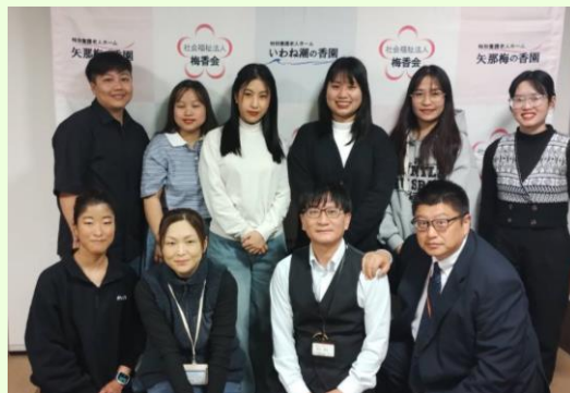
本部長、施設長、先輩介護士も加わって 🎵