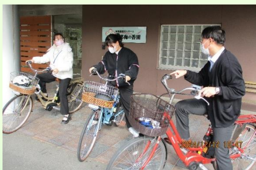
施設内をまず走ってみました。