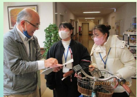
通勤経路を確認しています。