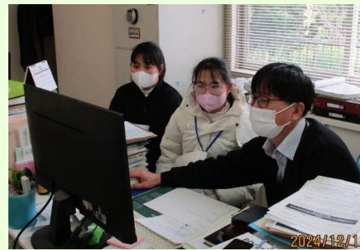
パソコン業務をお勉強中です。